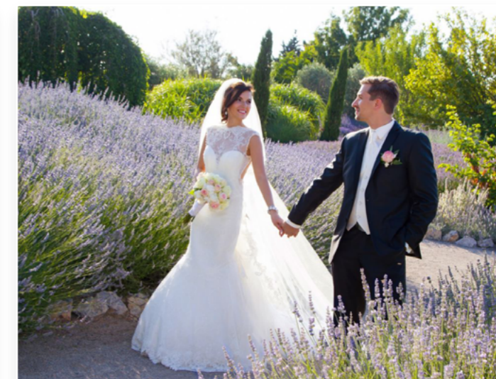
Foto Studio Semrad Hauptstraße 27 A-2120 Wolkersdorf im Weinviertel

Telefonnummer: +43 2245 /3204 Emailadresse: studio@fotosemrad.at Website: www.fotosemrad.at